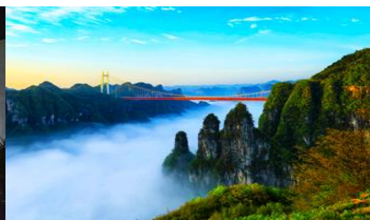
อุทยานป่าไม้แห่งชาติอ้อจ้าย