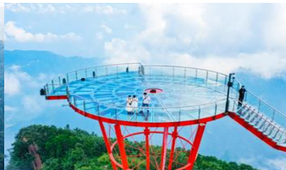
ระเบียงชมวิว Sky Eye