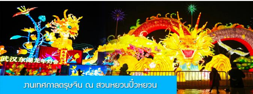
งานเทศกาลตรุษจีน ณ สวนหยวนเป๋วหยวน

วันที่ห้า เมืองจางเจียเจีย – เมืองเก็งจิว – นั่งรถไฟความเร็วสูงสู่หนครหวู่ฮั่น – เที่ยวงานฉลองเทศกาลตรุษจีน ร่วมงานเลี้ยงอาหารค่ำต้อนรับของทางการมณฑลหูเป่ย์ – นั่งรถไฟความเร็วสูงกลับเมืองหยีซัง