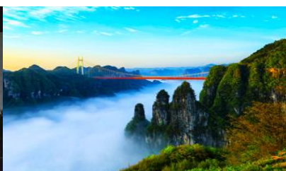
อุทยานป่าไม้แห่งชาติอ้อจ้าย