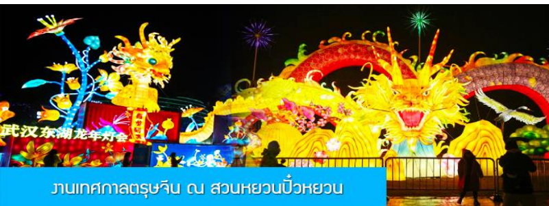
งานเทศกาลตรุษจีน ณ สวนหยวนเป๋วหยวน

วันที่ห้า เมืองจางเจียเจีย – เมืองเก็งจิว – นั่งรถไฟความเร็วสูงสู่หนครหวู่ฮั่น – เที่ยวงานฉลองเทศกาลตรุษจีน ร่วมงานเลี้ยงอาหารค่ำต้อนรับของทางการมณฑลหูเป่ย์ – นั่งรถไฟความเร็วสูงกลับเมืองหยีซัง