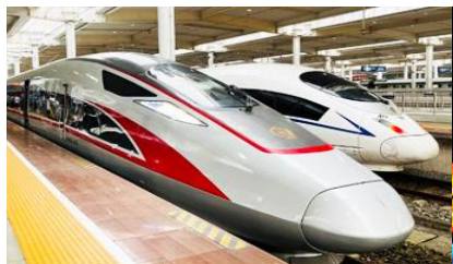
บัตรรถไฟความเร็วสูง

https://hk.trip.com/hotels/guzhang-hotel-detail-68614854/chaxitai-holiday-hotel/