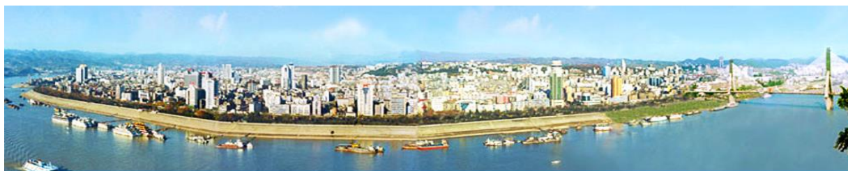
เมืองหยีซัง