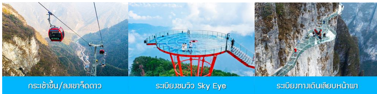
กระเช้าขึ้น/ลงเขาเจ็ดดาว

พักที่ ZHENMIN HOTEL โรงแรมระดับ 4 ดาวหรือเทียบเท่า