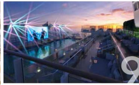
RESORTS WORLD BEACH CLUB There's party going on somewhere! Dive in at one of our famous pool parties or dance till dawn to the beat of our guest DJs at Resorts World Beach Club.