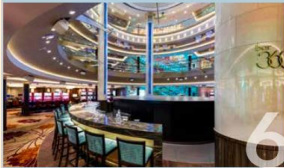
BAR CITY Sit back and enjoy world-renowned vintage, premium Scotch whiskeys, cocktails or bubbly while we entertain you with performances and live bands.