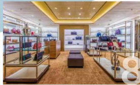
THE BOUTIQUE Splurge on International luxury brands at our boutiques or outlet store.