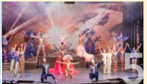
ZODIAC THEATRE Enjoy live production shows from our acclaimed entertainment team.