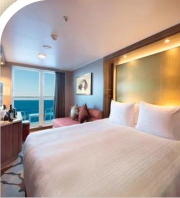
Oceanview Stateroom with Balcony