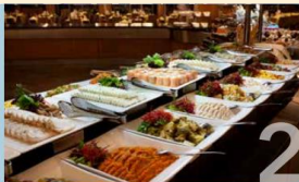
THE LIDO Our buffet-style restaurant with a smorgasbord of international and halal cuisine including vegetarian and non-vegetarian Indian dishes.