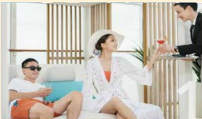
THE PALACE An exclusive all-suite, all inclusive enclave with private facilities and European-style butlers. It is a ship-within-a-ship boutique hotel for connoisseurs of true luxury and hospitality.

เช้า 📍 บริการอาหารเช้า ณ ห้องอาหารตามที่ทางเรือเตรียมไว้ให้ ท่านสามารถเข้าร่วมกิจกรรมที่ทางเรือจัดให้หรือพักผ่อนได้ตามอัธยาศัย อาทิ กิจกรรมกลุ่ม เช่น บิงโก , สอนทำลูกโป่งมายากล, กิจกรรมสอนศิลปะพื้นเมืองแบบง่ายๆ หรือใช้บริการห้องฟิตเนส , สระว่ายน้ำ, ปีนหน้าผาจำลอง, Mimi Golf, โบว์ลิ่ง และอีกหลากหลายกิจกรรมให้ท่านได้เลือกตามความชอบ (*บางกิจกรรม / ห้องอาหาร พิเศษ จะมีค่าใช้จ่ายเพิ่มเติม)