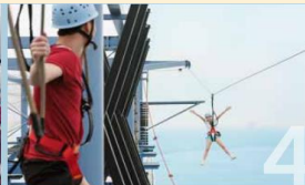
ROPE COURSE & ZIPLINE Feel the thrill of gliding above the ocean on a 35-metre zipline.