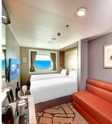
Oceanview Stateroom with Window