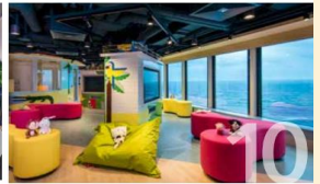
LITTLE DREAMERS CLUB Leave the kids with us while you explore the ship. They'll love our exciting line up of activities and classes. For kids aged 2 to 12.

กลางวัน 📍 บริการอาหารกลางวัน ณ ห้องอาหารตามที่ทางเรือเตรียมไว้ให้ หลังจากนั้น ท่านสามารถรับชมการแสดงที่ห้องโชว์หลัก (กรุณาสำรองที่นั่งล่วงหน้า) หรือดนตรีสดตามบาร์ต่างๆทั่วทั้งลำเรือ หลังจากนั้นพักผ่อนตามอัธยาศัย