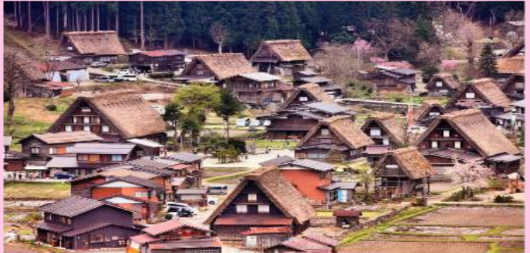
รูปนี้เพื่อประกอบการโฆษณาเท่านั้น