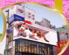
ช้อปปิ้ง ย่านชินจูกุ