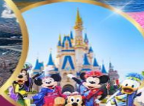
อิสระเลือกซื้อ Tokyo Disneyland