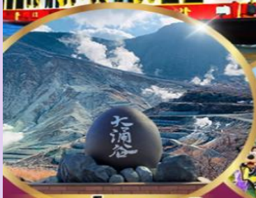
หุบเขาโอวาคุดานิ