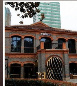
ย่านเฟิงเซินหลี่