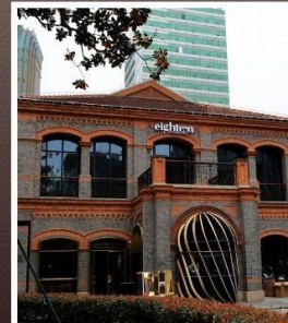
ย่านเฟิงเซินหลี่

รับฟรี!! ประกันสุขภาพ และ อุบัติเหตุ 2 ล้านบาท