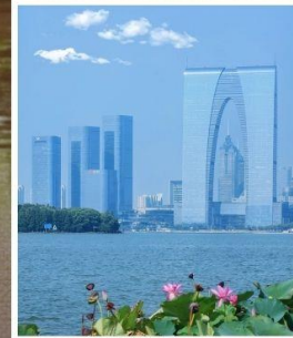
SUZHOU EAST GATE