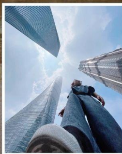
3 ตึกใหญ่ แห่งเมืองไฮ้