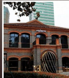
ย่านเฟิงเซินหลี่

รับฟรี!! ประกันสุขภาพ และ อุบัติเหตุ 2 ล้านบาท