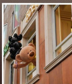
ถนนอันฟู่