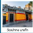
วัดเปากง มาเก๊า

ถนนฮอปป์ิงคารุอิซาว่า / สวนสาธารณะโอนิโอะชิดาชิ เมืองคุซัทสึ / นังกระเช้าฮาคุบะ อิวาตาเกะ จุดชมวิวกาคุบะเมทท์เทนฮาร์เบอร์ / คามิโคจิ / สะพานคัปปะ ปราสาทมัตสึโมโตะ / ฟูจิยามะ ทาวเวอร์ / ฮอปป์ิงชินจู วัดนาริตะ / อีออน พลาซ่า / วัดอามา / วัดเปากง เจ้าแม่กวนอิมปราสาททงริมทะเล / เซนาได้สแควร์ ถนนคนเดินไทปา / เดอะ ลอนดอนเนอร์ / เดอะ เวเนเชียน