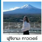
ฟูจิยามะ ทาวเวอร์