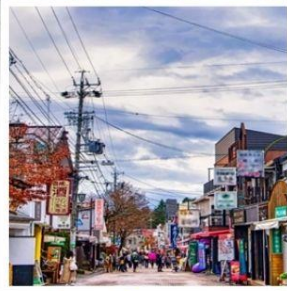
ถนนช้อปปิ้งคาร์ริซาว่า