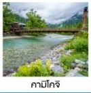
คามิโคจิ