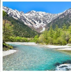
คามิโคจิ