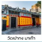
วัดเปากง มาเก๊า

ถนนฮอปปิงคารุอิซาว่า / สวนสาธารณะโอนิโอะชิดาชิ เมืองคุซัทสึ / นังกระเช้าฮาคุบะ อิวาตาเกะ จุดชมวิวฮาคุบะเมทท์เทนฮาร์เบอร์ / คามิโคจิ / สะพานคัปปะ ปราสาทมัตสึโมโตะ / ฟูจิยามะ ทาวเวอร์ / ฮอปปิงชินจูกุ วัดนาริตะ / อีออน พลาซ่า / วัดอามา / วัดเปากง เจ้าแม่กวนอิมปราสาททงริมทะเล / เซนาได้สแควร์ ถนนคนเดินไทปา / เดอะ ลอนดอนเนอร์ / เดอะ เวเนเชียน