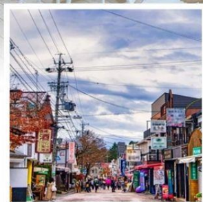
ถนนช้อปปิ้งคารุอิซาว่า