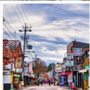
ถนนช้อปปิ้งคารุอิซาว่า