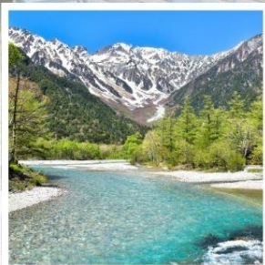
คามิโคจิ