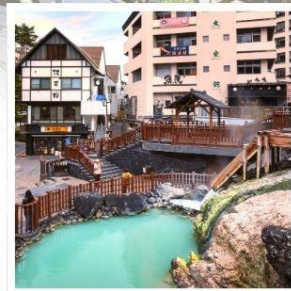
คุซัทสึ ออนเซ็น