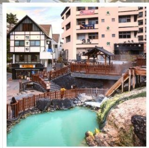
คุซัทสึ ออนเซ็น