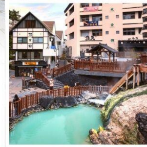
คุซัทสึ ออนเซ็น