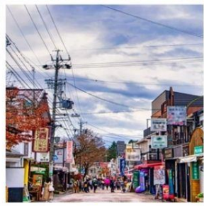
ถนนช้อปปิ้งคาร์ุชิชาว่า