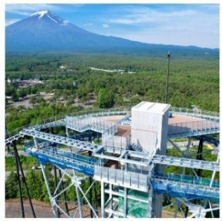
ฟูจิยามะ ทาวเวอร์