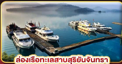
ล่องเรือทะเลสาบสุริยจันทร์