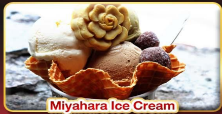
Miyahara Ice Cream