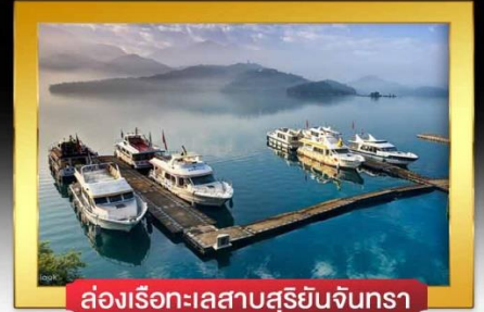
ล่องเรือทะเลสาบสุริยันจันทรา