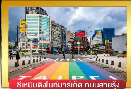
ซีเหมินติงไนท์มาร์เก็ต ถนนสายรุ้ง