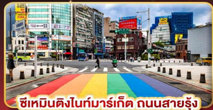
ซีเหมินติงไนท์มาร์เก็ต ถนนสายรุ้ง