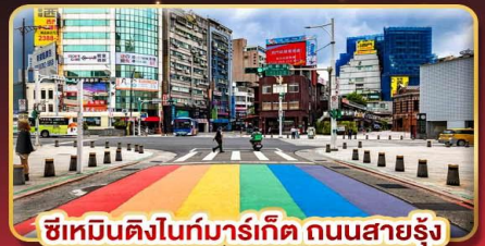
ซีเหมินติงไนท์มาร์เก็ต ถนนสายรุ้ง