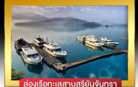
ล่องเรือทะเลสาบสุริยันจันทรา