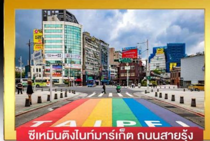
ซีเหมินติงไนท์มาร์เก็ต ถนนสายรุ้ง