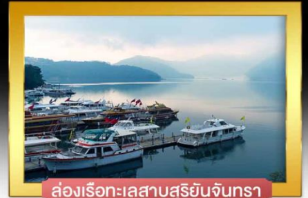
ล้จเรือทะเลสาบสุรย้จันทร