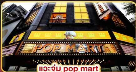
แฉะจุ่ม pop mart ที่ฮิตที่สุดในซีเหมินติง

ช้อปปิ้งจุใจ..ตลาดซีเหมินติง ตลาดโกจ้งไนท์มาร์เก็ต ตลาดเหลาเหอไนท์มาร์เก็ต