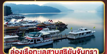
ล่องเรือทะเลสาบสุริยจีนตรา