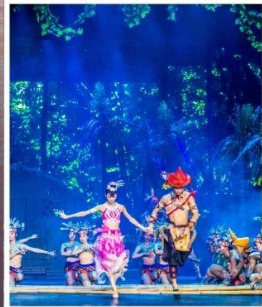
SANYA ROMANCE PARK