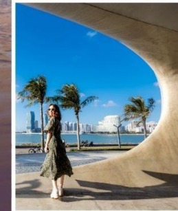
ห้องสมุดหยุนตง