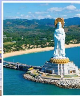
เจ้าแม่กวนอิม หนานซาน