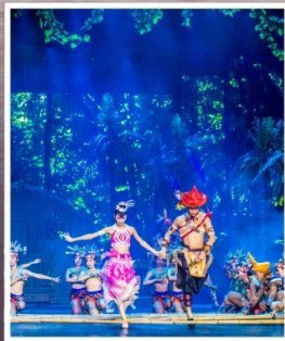
SANYA ROMANCE PARK