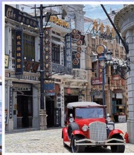
โรงถ่ายภาพยนตร์ เฟิ่งเสี่ยวกั๊ง