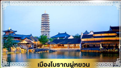
เมืองโบราณหมู่บ้าน