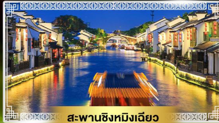
สะพานชิงหมิงเฉียว