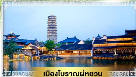
เมืองโบราณฝูหยวน