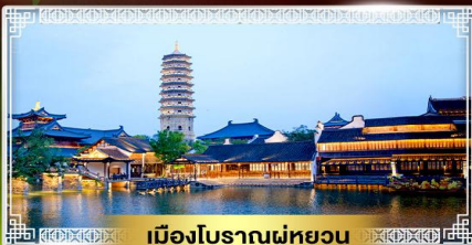
เมืองโบราณฝูหยวน