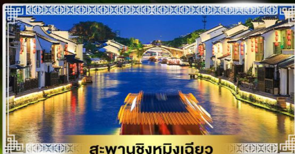
สะพานชิงหมิงเจียว