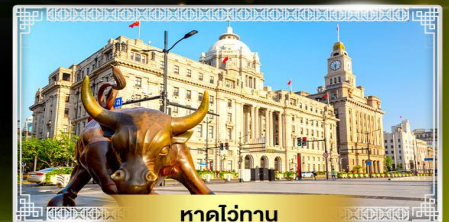
หาดโจกาน