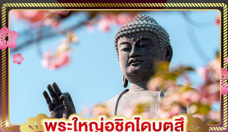
พระใหญ่อุชิคุโดบุตสึ