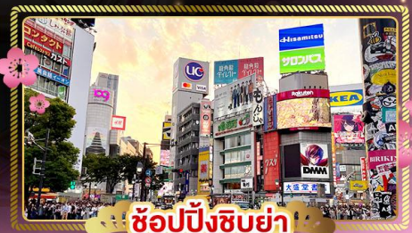
ช้อปปิ้งชิบูย่า