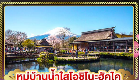
หมู่บ้านน้ำใสโอชิโนะฮักโค