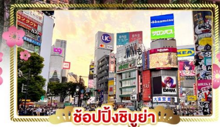
ช้อปปิ้งชิบูย่า