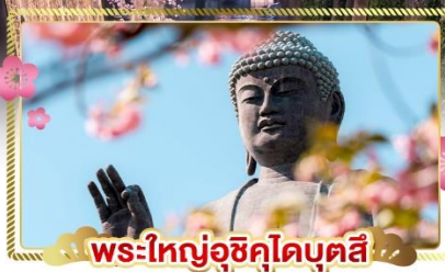
พระใหญ่อุซึคุไดบุตสึ