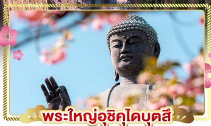
พระใหญ่อุซึคุไดบุตสึ