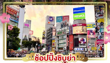
ช้อปปิ้งชิบูย่า