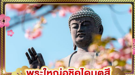
พระใหญ่อุซึกุโดบุตสึ