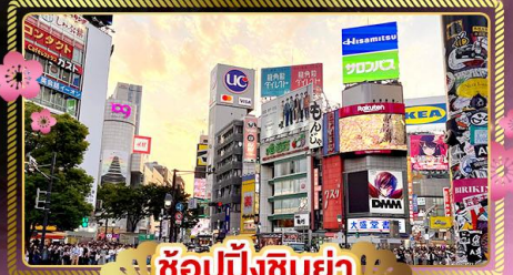
ช้อปปิ้งชิบูย่า