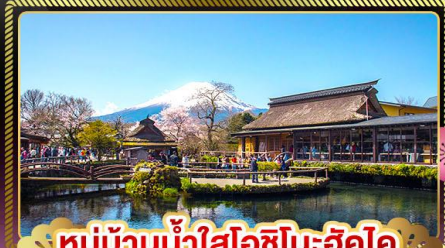
หมู่บ้านน้ำใสโอชิโนะฮัคโค