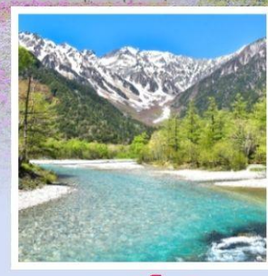
คามิโคจิ