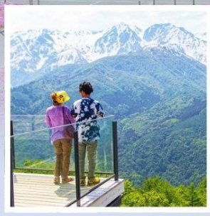
ฮาคุบะอิวาตาคะ