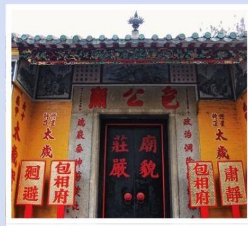
วัดเปากง