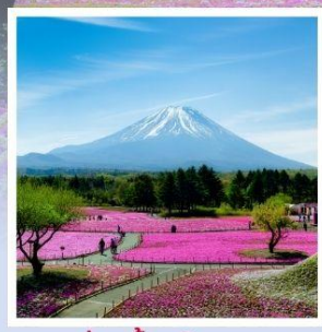
ทุ่งพืชมอส