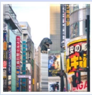
ซ็อบบิงชินจูกุ