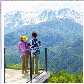
ฮาคุบะอิวาตาคะ