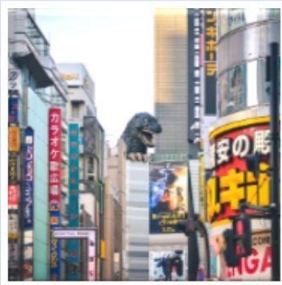
ซ็อบบิงชินจูกุ