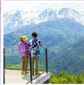
ฮาคุบะอิวาตาคะ