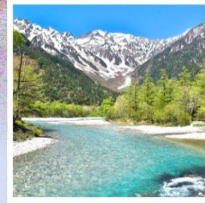
คามิโคจิ