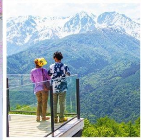
ฮาคุบะอิวาตาคะ