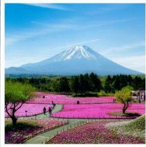
ทุ่งพืชมอส