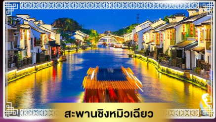
สะพานชิงหิวเฉียว