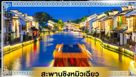
สะพานชิงหมิงเจียว