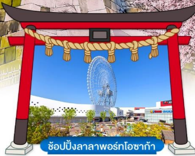
ซ้อปิ้งลาลาพอร์ทโอซาก้า