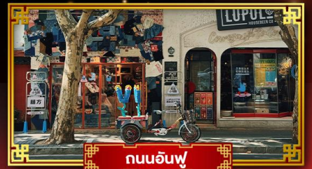
ถนนอันฟู่