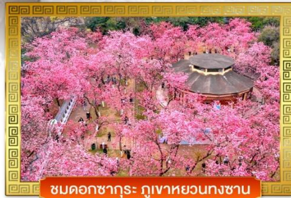
ชมดอกซากุระ ภูเขาหยวนกงซาน