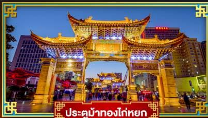
ประตูมังกรโก่หยก