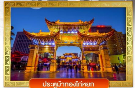
ประตูม้าทองโก่หยก