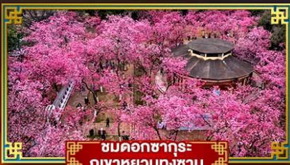
ชมดอกซากุระ ภูเขาหวนกงซาน