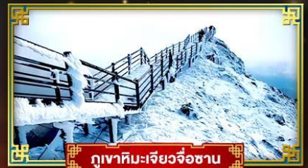
ภูเขาหิมะเจียวจื่อซาน