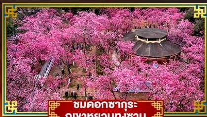
ชมดอกซากุระ ภูเขาหยวนทงซาน

นั่งกระเช้าขึ้นสู่ยอดเขาเจียวจื่อซาน ชมความงามดอกทิวลิป ดอกซากุระบาน