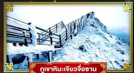
ภูเขาหิมะเจียวจื่อซาน