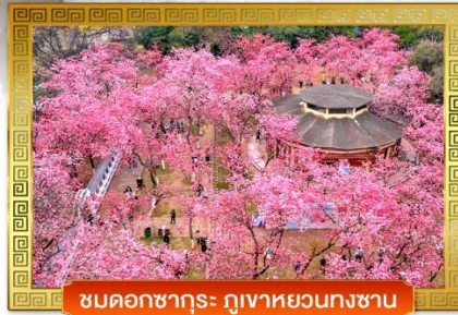
ชมดอกซากุระ ภูเขาหวนทงซาน