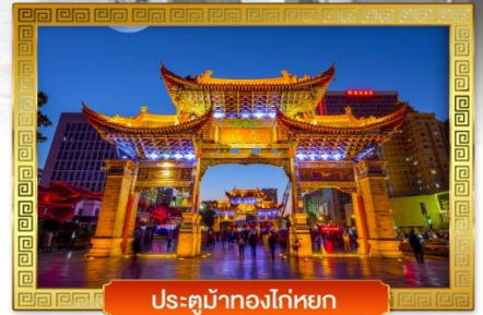
ประตูม้าทองโก่หยก