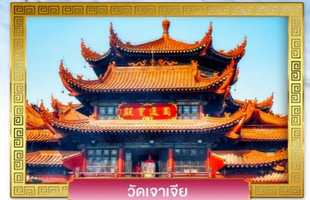
วัดเจาเจีย