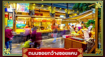
ถนนชอยกว้างชอยแคบ