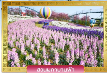
สวนพลาบานฟ้า