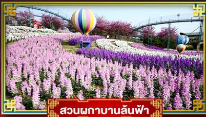
สวนพลาบานลันฟ้า

★ ชมความงาม ระดับ 4A อุทยานสวรรค์กุหาหิมะการ์เซียต้ากู่ปิงชว่น