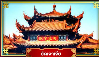
วัดเจาเจีย