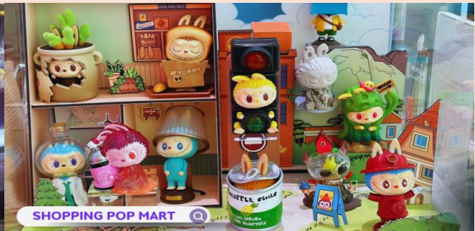
SHOPPING POP MART