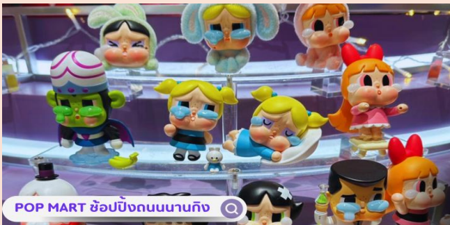
POP MART ซ้อปบิงกบนานกิง