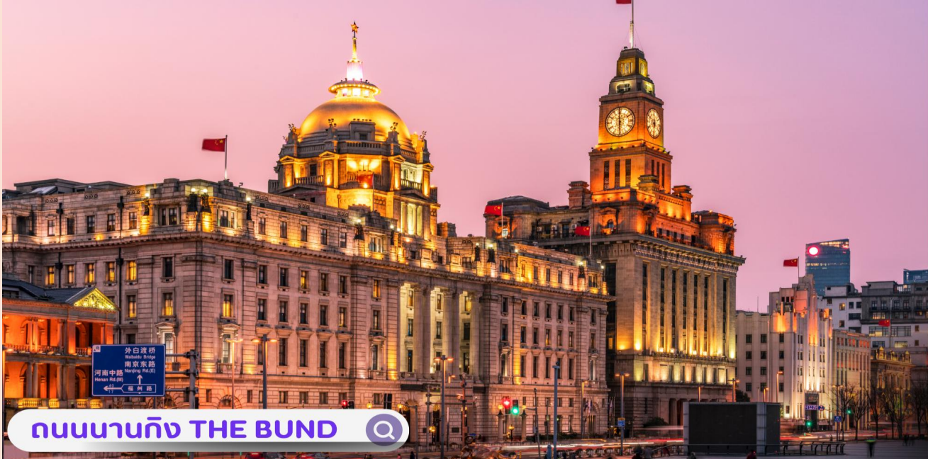
ถนนนานกิง THE BUND

จากนั้นอิสระท่านเฟลิดเฟลินที่ ถนนนานกิง(NANJING ROAD) เป็นย่านช้อปปิ้งเก่าแก่ที่สุดของเซี่ยงไฮ้ เป็นตลาดซื้อขายของกันคึกคักตั้งแต่ทศวรรษ 1920 ตั้งอยู่ฝั่งผู้ซีกินพื้นที่ยาวตั้งแต่ฝั่งตะวันตกของ “เดอะ บันด์” ถึง “พีเพิลส์ สแควร์” เป็นแหล่งช้อปปิ้งสินค้าแบรนด์เนมจากทั่วโลก และยังเป็นศูนย์รวมร้านค้าและร้านอาหารอีกมากมาย และพลาดไม่ได้กับนักกลุ่มอาร์ททอยอย่าง แบรินต์ POPMART GLOBAL FLAGSHIP STORE ร้านขายของเล่นที่เป็นที่โด่งดังในขณะนี้ไม่ว่าจะ LABUBU MOLLY SKULLPANDA และอย่างอื่นอีกมากมาย ให้ท่านได้เลือกลุ้นกับอย่างสนุกสนาน