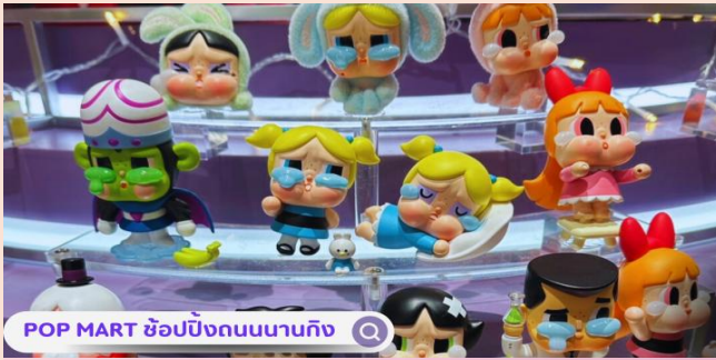
POP MART ซ้อปิ้งถนนนานกิง