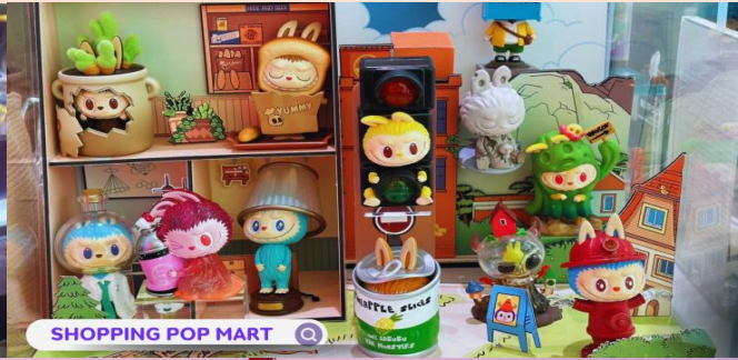
SHOPPING POP MART