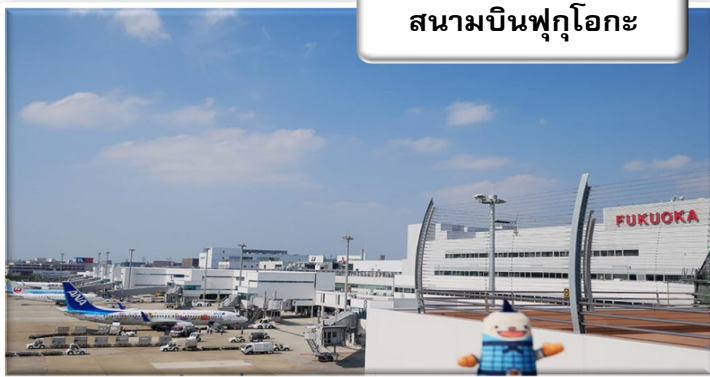
สนามบินฟุกุโอกะ

00.55 น. ออกเดินทางสู่ สนามบินฟุกุโอกะ ประเทศญี่ปุ่น โดยสายการบินไทย เที่ยวบินที่ TG 648