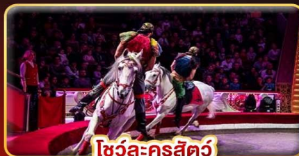
โชว์ละครสัตว์