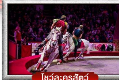
โชว์ละครสัตว์