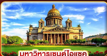
มหาวิหารเซนต์ไอแซค

เดินทาง : 21-28 มี.ค.68 | 07-14 เม.ย.68 28 เม.ย.-05 พ.ค.68