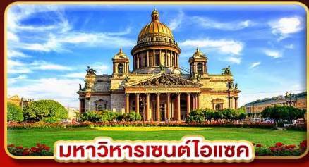
มหาวิหารเซนต์ไอแซค

📅 เดินทาง : 21-28 มี.ค.68 | 07-14 เม.ย.68 28 เม.ย.-05 พ.ค.68