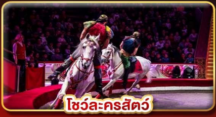
โชว์ละครสัตว์