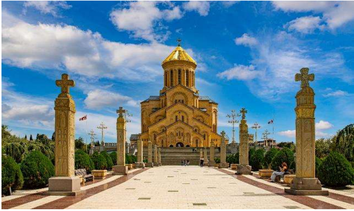
Cathedral of Tbilisi (วัดมหาวิหารตรีเอกภาพแห่งทบิลีซี หรือ Sameba Cathedral) เป็นหนึ่งในสัญลักษณ์สำคัญของเมืองทบิลีซี และเป็นวิหารที่สำคัญที่สุดในศาสนาคริสต์ออร์ทอดอกซ์ของจอร์เจีย ตั้งอยู่บนเนินเขาในเขต Avlabari

02.30 น. ออกเดินทางสู่กรุงโดฮา โดยสายการบินกาดัวร์แอร์เวย์ เที่ยวบินที่ QR837 05.30 น. เดินทางถึงกรุงโดฮา ประเทศกาตาร์ พักเปลี่ยนเครื่อง 08.50 น. เหมิรฟ้าสู่เมืองทบิลีซี ประเทศจอร์เจีย...โดยสายการบินกาดัวร์แอร์เวย์ เที่ยวบินที่ QR255 13.00 น. เดินทางถึงสนามบินนานาชาติทบิลีซีประเทศจอร์เจีย หลังผ่านการตรวจคนเข้าเมืองและศุลกากรแล้ว นำท่านออกเดินทางเข้าสู่เมืองทบิลีซี นำท่านเดินทางสู่เมืองทบิลีซี (Tbilisi) เมืองหลวงของประเทศจอร์เจีย เป็นเมืองที่เต็มไปด้วยเสน่ห์ทั้งในแง่ของประวัติศาสตร์, วัฒนธรรม, สถาปัตยกรรม, และธรรมชาติ เมืองนี้มีสถานที่ท่องเที่ยวที่น่าสนใจมากมาย ซึ่งรวมถึงอาคารโบราณ, พิพิธภัณฑ์, วิหาร, และทิวทัศน์ที่สวยงามจากภูเขาและแม่น้ำ ชมความงามและประวัติศาสตร์เก่าของจอร์เจียผ่านสถาปัตยกรรมคู่มือเมืองอันงดงามแห่งนี้ เมืองนี้มีโบสถ์หลายแห่งที่มีความสูงตระหง่าน งดงาม อีกทั้งยังมีย่านเมืองเก่าที่มีความสวยงาม ชมเส้นทางเก่าแก่ พร้อมบรรยากาศตัวเมืองดีกร้าบ้านช่องแบบจอร์เจีย อีกทั้งยังมีสุเหร่าและสถาปัตยกรรมยุคสมัยใหม่มากมาย นำท่านเก็บภาพกับ Holy Trinity