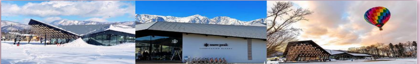
รูปใช้เพื่อประกอบการโฆษณาเท่านั้น

นำท่านจิบกาแฟพร้อมกับชมวิวทิวทัศน์ธรรมชาติอันงดงามของฮาคุบะที่ STARBUCK SNOW PEAK LAND (ไม่รวมค่าเครื่องดื่ม) ตั้งอยู่ที่ SNOW PEAK LAND STATION HAKUBA สถานที่ตั้งแคมป์ท่ามกลางธรรมชาติอันอุดมสมบูรณ์ที่มีเทือกเขางามเป็นฉากหลัง มีทั้งที่นั่งในร่มและกลางแจ้งให้เราได้เลือกเสพบรรยากาศตามใจชอบ พร้อมจำหน่ายสินค้าฉลองการเปิดตัวด้วยสกรีนยืดห่อ Snow Peak ลงในผลิตภัณฑ์ที่จำหน่ายภายในสตาร์บัคส์ด้วย