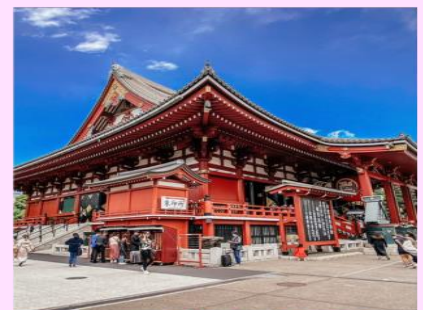
วัดอาซากุสะ SENSOJI TEMPEL | ASAKUSA TOKYO