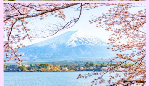
รูปใช้เพื่อประกอบการโฆษณาเท่านั้น