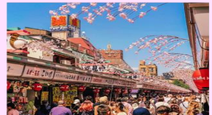
รูปใช้เพื่อประกอบการโฆษณาเท่านั้น