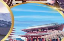
วัดเซ็นโซจิ