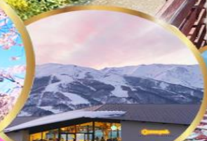
Starbucks snow peak land