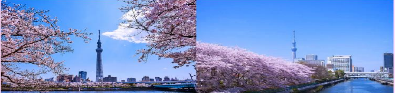
TOKYO SKY TREE & SUMIDA RIVER

จากนั้นนำท่านแวะ ถ่ายรูปรูปทอคอยโตเกียวสกายทรี (Tokyo Sky Tree) ริมน้ำสุมิเดะ (Sumida River) ทอคอยที่สูงที่สุดในโลก จัดเป็นแลนด์มาร์กอีกอย่างหนึ่งของกรุงโตเกียว นำท่านชม ซากุระ บริเวณริมน้ำสุมิเดะที่มีต้นซากุระจำนวนมากกว่า 1,000 ต้น และเป็นทอส่งสัญญาณโทรคมนาคมที่สูงที่สุดในโลก นอกจากนี้ท่านจะยังได้ชื่นชมความสวยงามของดอกซากุระที่บ้านเรียงรายอยู่ริมทางเดินเลียบบแม่น้ำสุมิเดะอีกด้วย ( การบานและโรยของดอกซากุระขึ้นอยู่กับธรรมชาติและสภาพอากาศ ) อิสระให้ท่านเก็บภาพตามอัธยาศัย