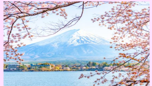
รูปใช้เพื่อประกอบการโฆษณาเท่านั้น