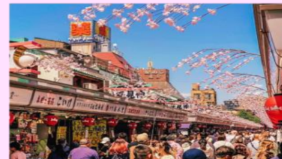
รูปใช้เพื่อประกอบการโฆษณาเท่านั้น