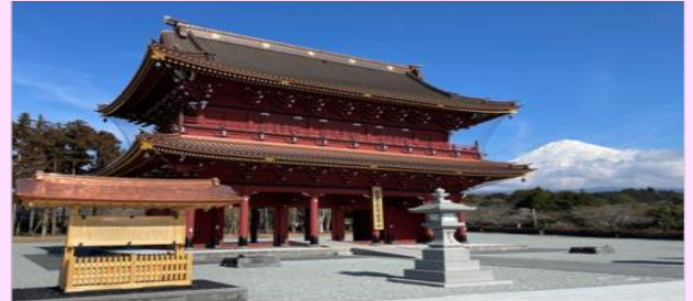
รูปใช้เพื่อประกอบการโฆษณาเท่านั้น