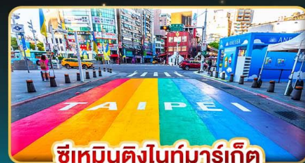
ซีเหมินติงไถ่บาร์เกิต