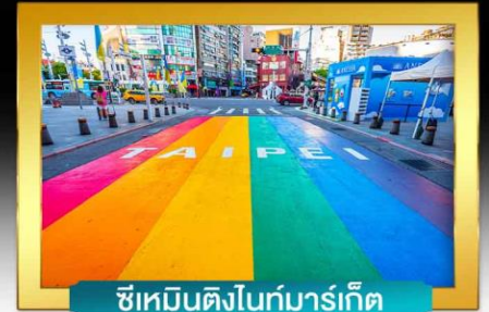
ซีเหมินติงไนท์มาร์เก็ต