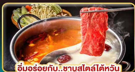
อิ่มอร่อยกับ..ชาบูสไตล์ไต้หวัน เมนูหม้อนึ่งจักรพรรดิ เสียวหลงเปา