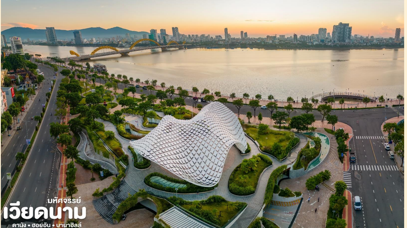
บึงจรรยา เวียดนาม คาบิง • ฮอยอัน • บานาฮิลล์