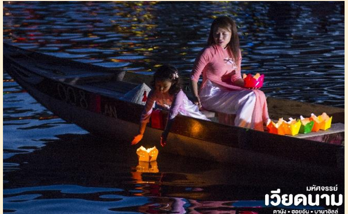
มหัสจรรย์ เวียดนาม คาบัง • ฮอยอัน • บานาฮิลล์

เย็น ๑๐ บริการอาหารเย็น ณ ร้านอาหาร ที่พัก เข้าสู่ที่พัก SEA GARDEN HOTEL 4* หรือเทียบเท่ามาตรฐานเวียดนาม (โรงแรมที่ระบุในรายการทัวร์เป็นเพียงโรงแรมที่น่าเสนอเบื้องต้นเท่านั้น ซึ่งอาจมีการเปลี่ยนแปลงแต่โรงแรมที่เข้าพักจะเป็นโรงแรมระดับเทียบเท่ากัน)