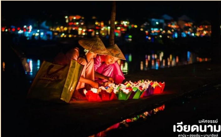
มหัสจรรย์ เวียดนาม คาบัง • ฮอยอัน • บานาฮิลล์