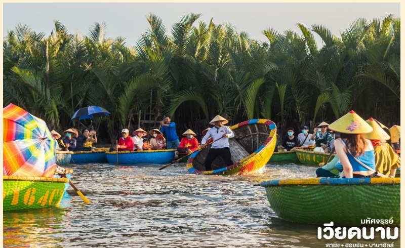
บึงจรรยา เวียดนาม คาบิง • ฮอยอัน • บานาฮิลล์

นำท่านเดินทางสู่ หมู่บ้านกัมทาน สนุกสนานไปกับกิจกรรม!! นั่งเรือ กระดิ่ง Cam Thanh Water Coconut Village หมู่บ้านเล็กๆ ในเมืองฮอยอันตั้งอยู่ในสวนมะพร้าวริมแม่น้ำ ในอดีตช่วงสงครามที่นี่เป็นที่พักอาศัยของเหล่าทหาร อาชีพหลักของคนที่นี่คืออาชีพประมง ระหว่างการ