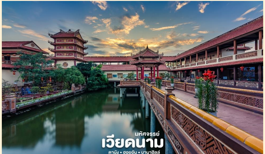
มหัสจรรย์ เวียดนาม คาบัง • ฮอยอัน • บานาฮิลล์

เช้า ๑๑ บริการอาหารเช้า ณ ห้องอาหารของโรงแรม จากนั้น นำท่านชม วัดนามเซิน (Nam Son Pagoda) หรือ เจดีย์นัมเซิน ถูกสร้างขึ้นในปี 1962 เจดีย์นัมเซินมีรูปแบบสถาปัตยกรรมตามแบบฉบับของเวียดนามตอนกลางดั้งเดิม เจดีย์แบ่งออกเป็น หลายพื้นที่โดยมีลักษณะเฉพาะของตัวเอง ได้แก่ ทะเลสาบฟองซัน สะพานทามทัง ศาลาวงเหิงยงเหวียด อาคารเกสต์เฮาส์ ห้องโถงหลัก สะพานดงทู เป็นต้น