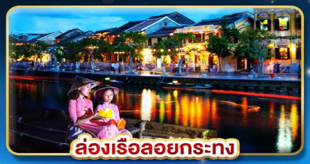
ล่องเรือลอยกระทง