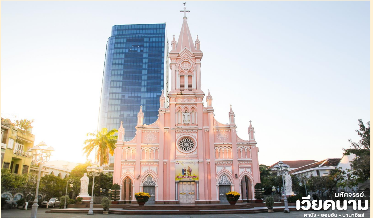
มหาจักรพรรดิ เวียดนาม ดานัง • ฮอยอัน • บานาฮิลล์

ได้เวลาสมควรนำท่านเดินทางสู่ สนามบินดานัง