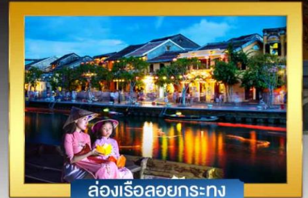
ล่องเรือลอยกระทง