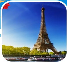
อาหารพิเศษภัตตาคาร Madame-Brasserie