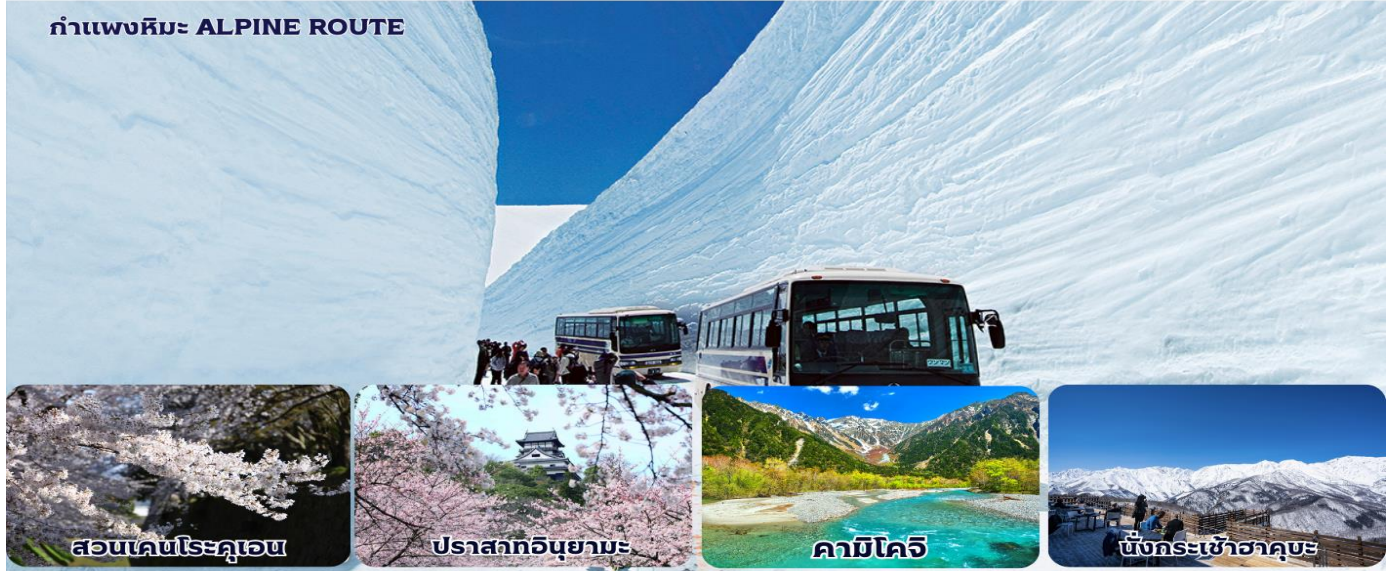
สวนเคนโรคุเอน