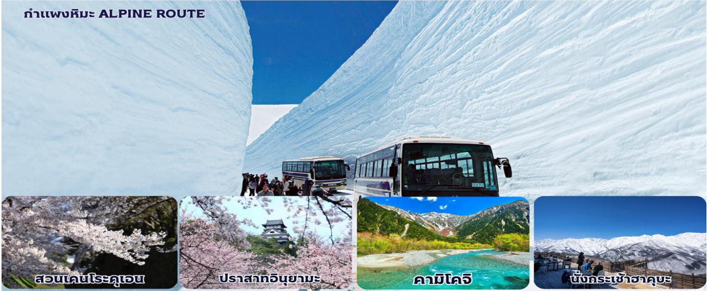
สวนเคนโรคุเอน