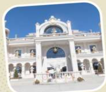
6 POP LAND