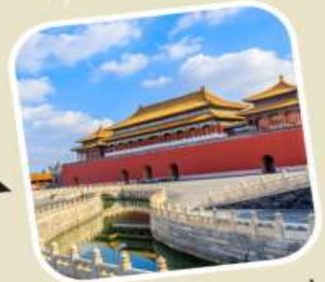
3 พระราชวังต้องห้าม