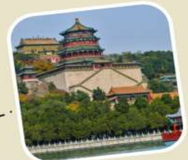
4 พระราชวังฤดูร้อน